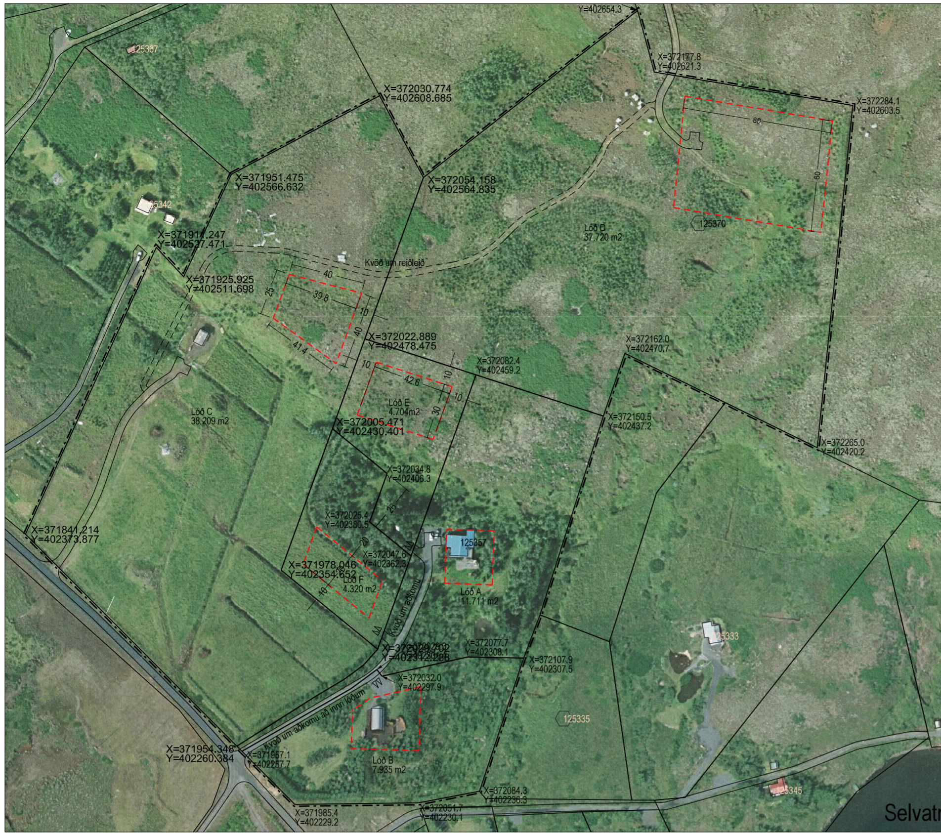
Deiliskipulag fyrir breytingu, mælikvarði 1 : 2.000