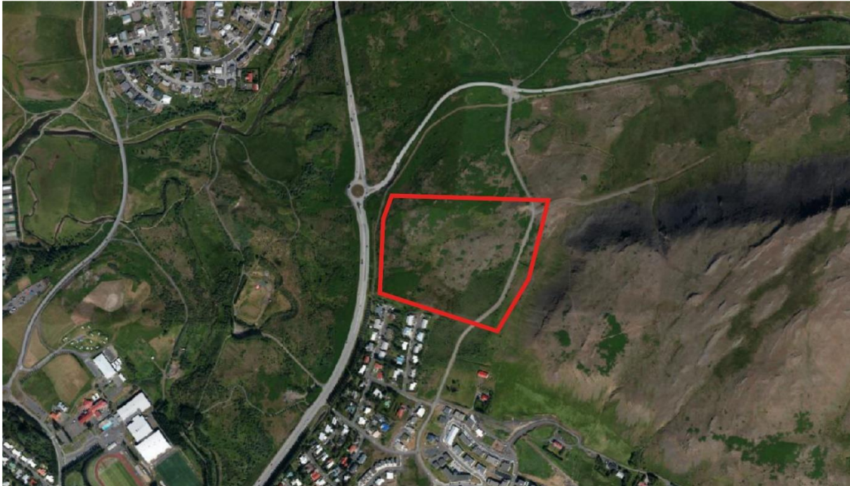
Mynd 1. Skipulagsmörk 6. áfanga sýnd með rauðu. Loftmynd frá árinu 2020.

Skipulagslýsing þessi var samþykkt til kynningar af bæjarstjórn Mosfellsbæjar þann XX.XX.2021.