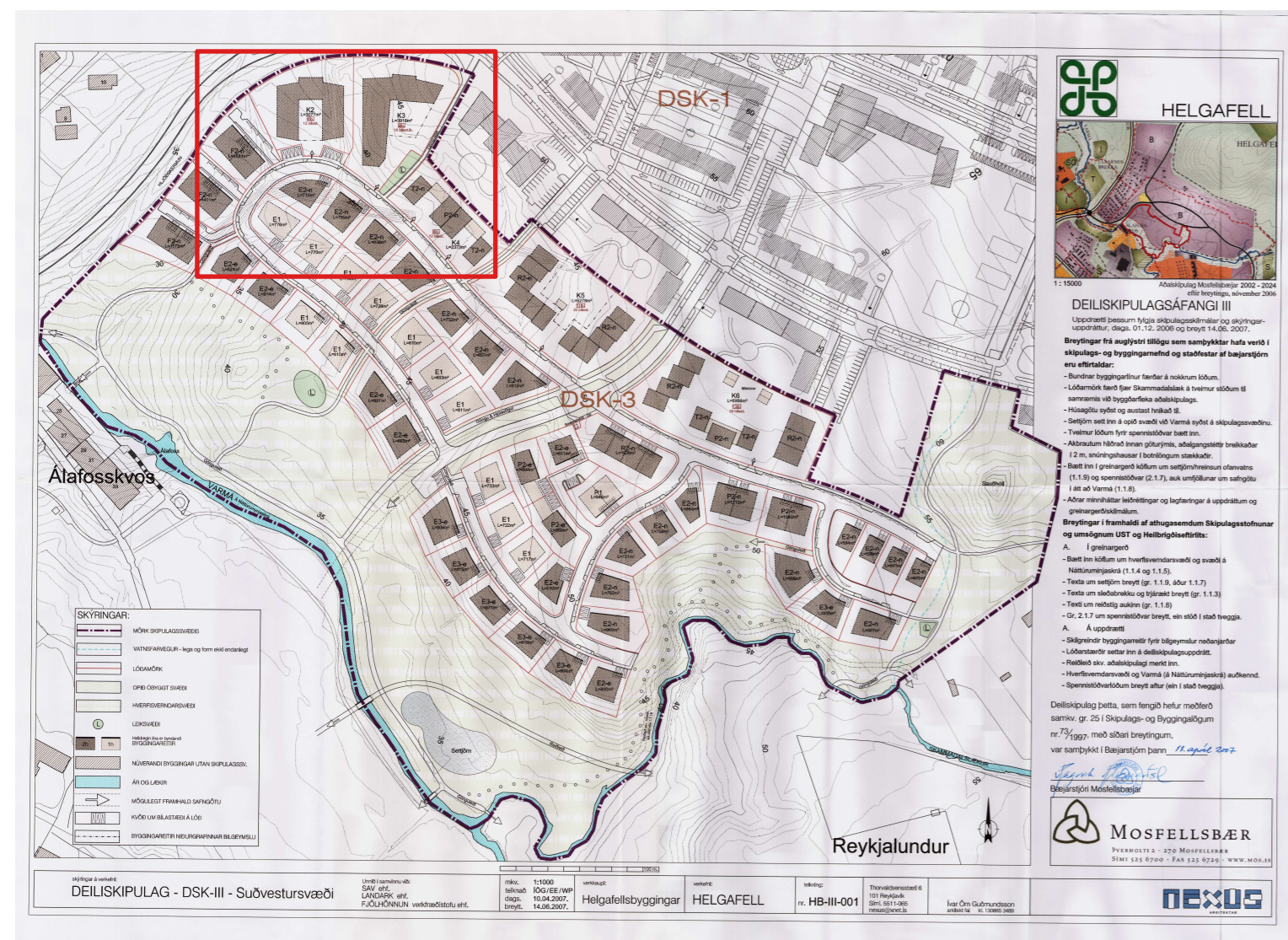
Deiliskipulag Helgafellshverfis, 3. áfangi,